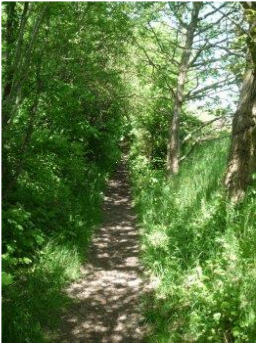
Hulvejen syd for Vilhelmsro

I øvrigt har kommunen lovet i år at udarbejde en bekæmpelsesplan, der efter høring kan træde i kraft i 2011. Inden for det område, som planen dækker, bliver grundejerne herefter forpligtede til at bekæmpe planten. Det ser vi frem til.