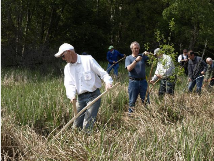
Fra et af sidste sommers høslætarrangementer

Som nævnt i et af vores tidligere nyhedsbreve har vi taget initiativet til at danne et høslætlaug, der i øjeblikket har omkring tyve medlemmer. Lauget slår hør på Skovfogedengen i Gl. Grønholt Vang et par gange i løbet af sommeren, men for de særligt energiske er der mulighed for også at tage fat på et areal lidt østligere ved den vej, der hedder Grønholtvængen, samt på en række høje vejskråninger.