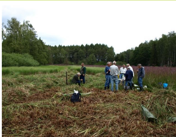
Høslætlaugten nyder en velfortjent frokost

Skovfogedengen ligger i Gl. Grønholt Vang nogle hundrede meter vest for voldstedet. Af gamle kort kan man se, at den fandtes for 150 år siden, men formentlig er den meget ældre. Den har givetvis været græsset, men det er længe siden.