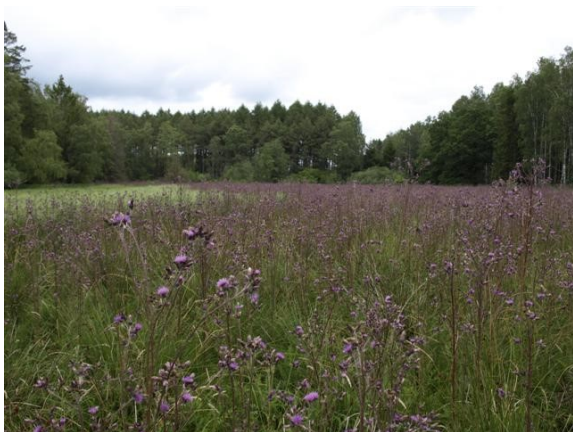
Kærtidsler i massevis (2009)

blev stiftet i 2009 på initiativ af Naturfredningsforeningens Fredensborgafdeling med økonomisk støtte fra Friluftsrådets tips og lotto-midler til friluftslivet. Inspirationen kom fra Strøgårdsvang Høslætlaug, som slår engen Nydam i Gribskov.