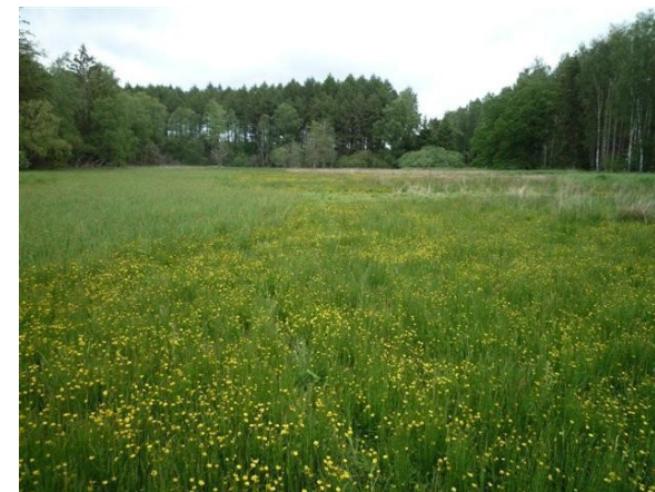
Lav ranunkelt begunstiges af høslæt (2012)

2014 var antallet vokset til 76. I 2009 var der 4 blomstrende kødfarvet gøgeurt, i 2014 hele 62! Der er også et rigt dyreliv, f.eks. markfirben, salamander og snog, og i sommeren 2014 blev der på en time observeret ikke mindre end 18 sommerfuglearter.