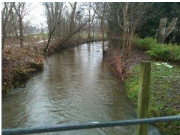
Usserød Å øst for Egedalsvænget i Kokkedal fyldt med smeltevand 17. januar 2011

Som nævnt i vores forrige nyhedsbrev er DN Fredensborg sammen med bl.a. Sportsfiskerforbundet blevet medlem af en gruppe, der skal følge arbejdet med at undgå nye oversvømmelser i de dele af Kokkedal, der ligger op mod Usserød Å. Følgegruppen har allerede været indkaldt flere gange og har fået forelagt beregninger ved det rådgivende ingeniørfirma Niras. Beregningerne forudsætter bl.a. etablering af et såkaldt dobbeltprofil langs åen, så den får et bredere løb, når vandstanden er høj – men ellers holder sig til det nuværende løb (se også det forrige nyhedsbrev). Vi har også fået forelagt en landskabsplan ved arkitektfirmaet Hasløv & Kjærsgaard, der knytter sig til ingeniørernes beregninger. Vi var blevet bedt om en udtalelse forud for Miljø- og Teknikudvalgets januar-møde og skrev bl.a.: