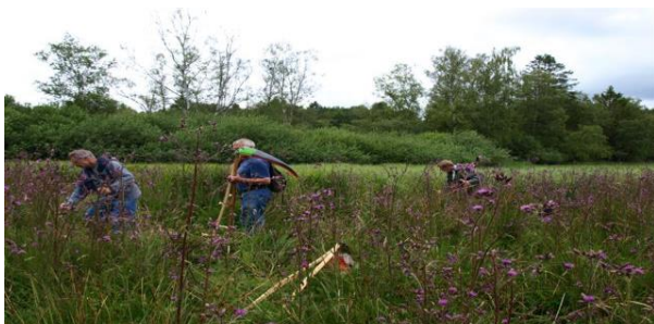
Medlemmer af høslætlauguet i fuld aktivitet på Skovfogedengen