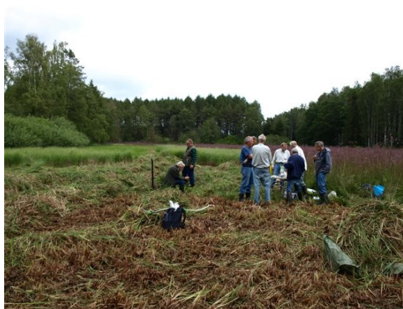
Høslætlaugten nyder en velfortjent frokost

Skovfogedengen ligger i Gl. Grønholt Vang nogle hundrede meter vest for voldstedet. Af gamle kort kan man se, at den fandtes for 150 år siden, men formentlig er den meget ældre. Den har givetvis været græsset, men det er længe siden.